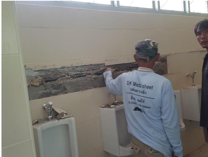
ภาพแสดง การซ่อมแซมสุขภัณฑ์ในห้องน้ำ