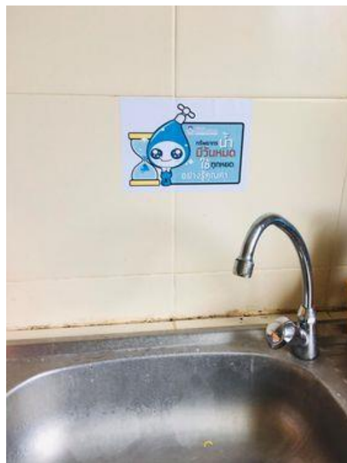
ภาพแสดง การรณรงค์การประหยัดน้ำ