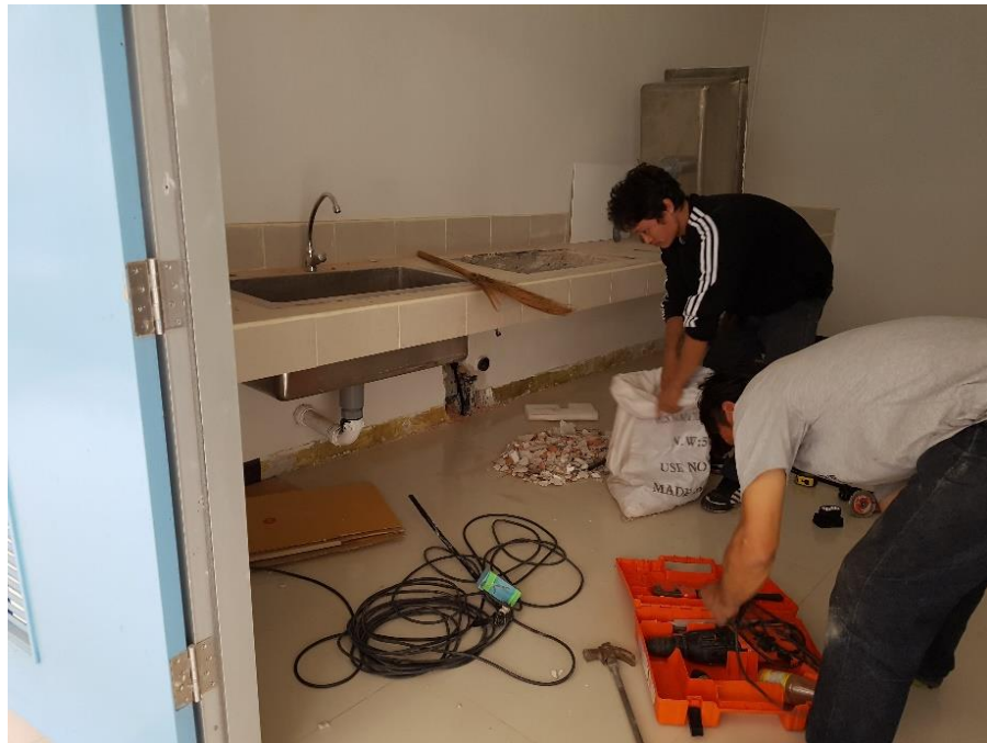
ภาพแสดง การซ่อมแซมน้ำรั่วในตัวอาคาร