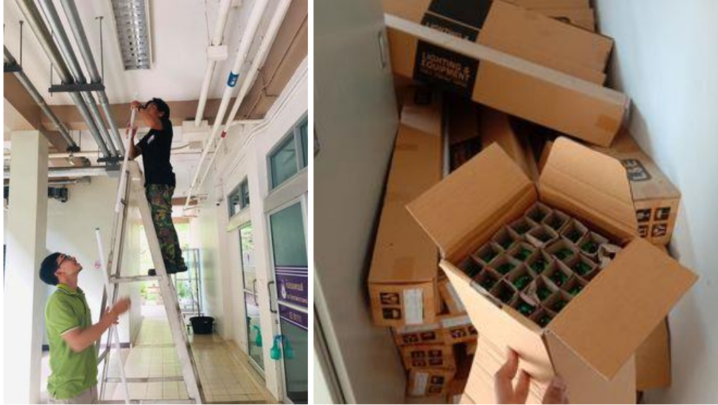
ภาพแสดง การเปลี่ยนหลอดไฟลูออเรสเซนต์เป็นหลอด LED