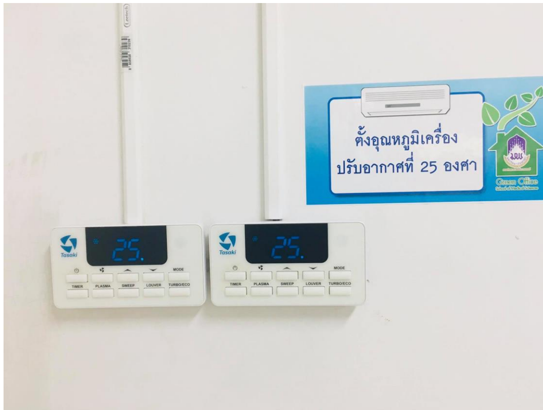
ภาพแสดง การรณรงค์ประหยัดพลังงานเครื่องปรับอากาศ