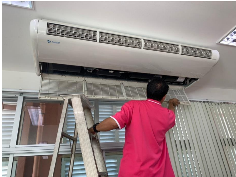
ภาพแสดง การล้างเครื่องปรับอากาศ