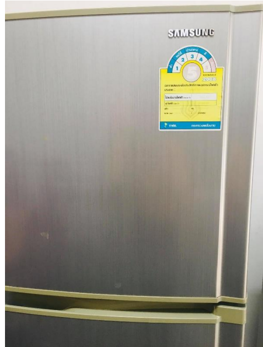
ภาพแสดง ครุภัณฑ์สำนักงานที่มีฉลากประหยัดไฟ