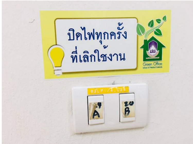
ภาพแสดง การรณรงค์การประหยัดไฟฟ้า