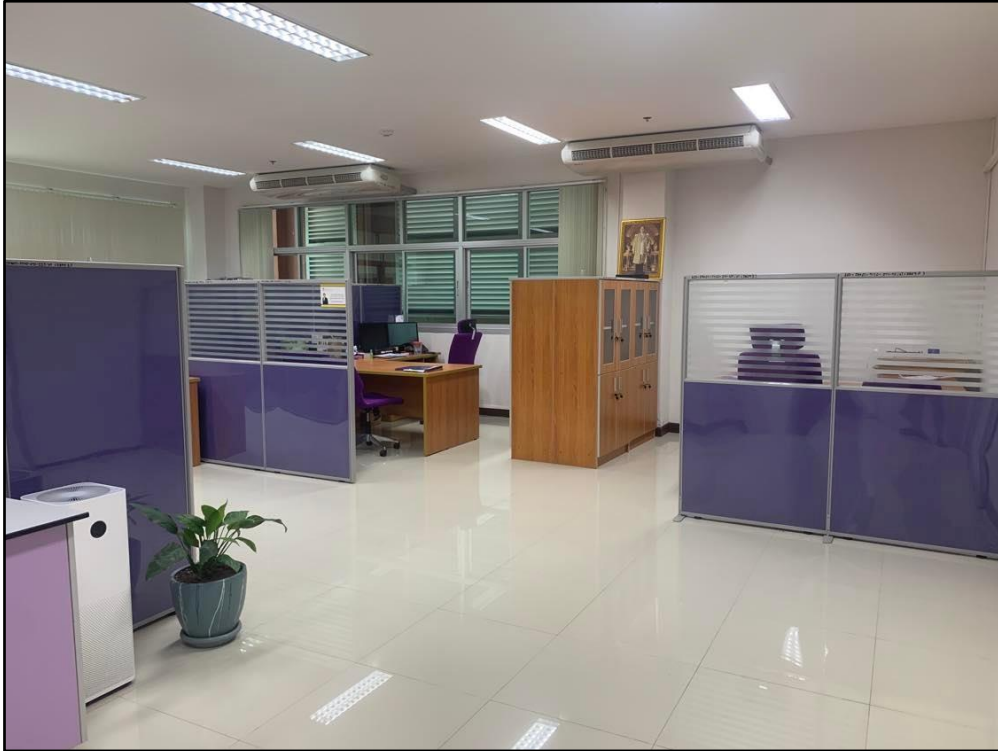
พื้นที่ห้องทำงานเจ้าหน้าที่ธุรการ