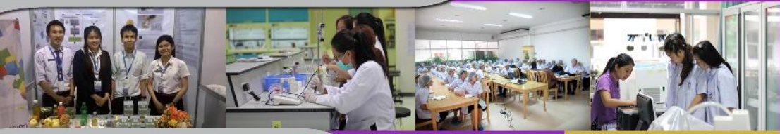
การรับการสอน ห้องเรียน และ อุปกรณ์การเรียนที่ทันสมัย