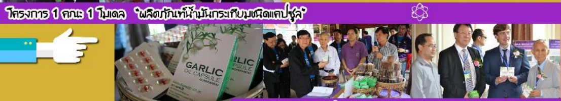
โครงการ 1 ตำบล 1 โมเดล "ผลิตกินพื้นที่บ้านกระเทียมเขตแดนพิเศษ"

บูรณาการวิชาการและงานวิจัยด้วยโจทย์ปัญหาของชุมชน ช่วยเพื่อเพิ่มมูลค่า "กระเทียม" ของดีและขึ้นชื่อของตำบลบ้านด้าอ.คอกคำใต้ มีการจัดแสดงนิทรรศการในงานประชุมนานาชาติหลายแห่ง ได้รับความสนใจจากชาวไทยและชาวต่างชาติ